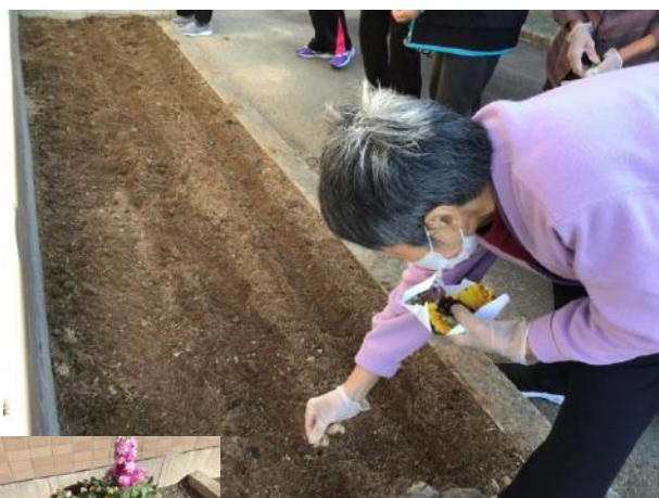
通所前にお花を植えました！

通所リハビリは9月14日より再開することができました。多くのご利用者様に戻ってきて頂き、34名でスタートし、現在では57名のご利用者様に利用して頂いている状況です。再開後は感染予防策を強化し男性・女性のグループ分けをし、担当する職員も男性・女性に分かれて業務をさせて頂いています。以前のようなレクリエーション等ができない状況ですが、職員もご利用者様に楽しんで頂けるよう日々考えながら取り組んでいる所です。ご利用者様に太陽通所リハビリが再開できて良かったと思って頂けるよう職員一同頑張っていきます。